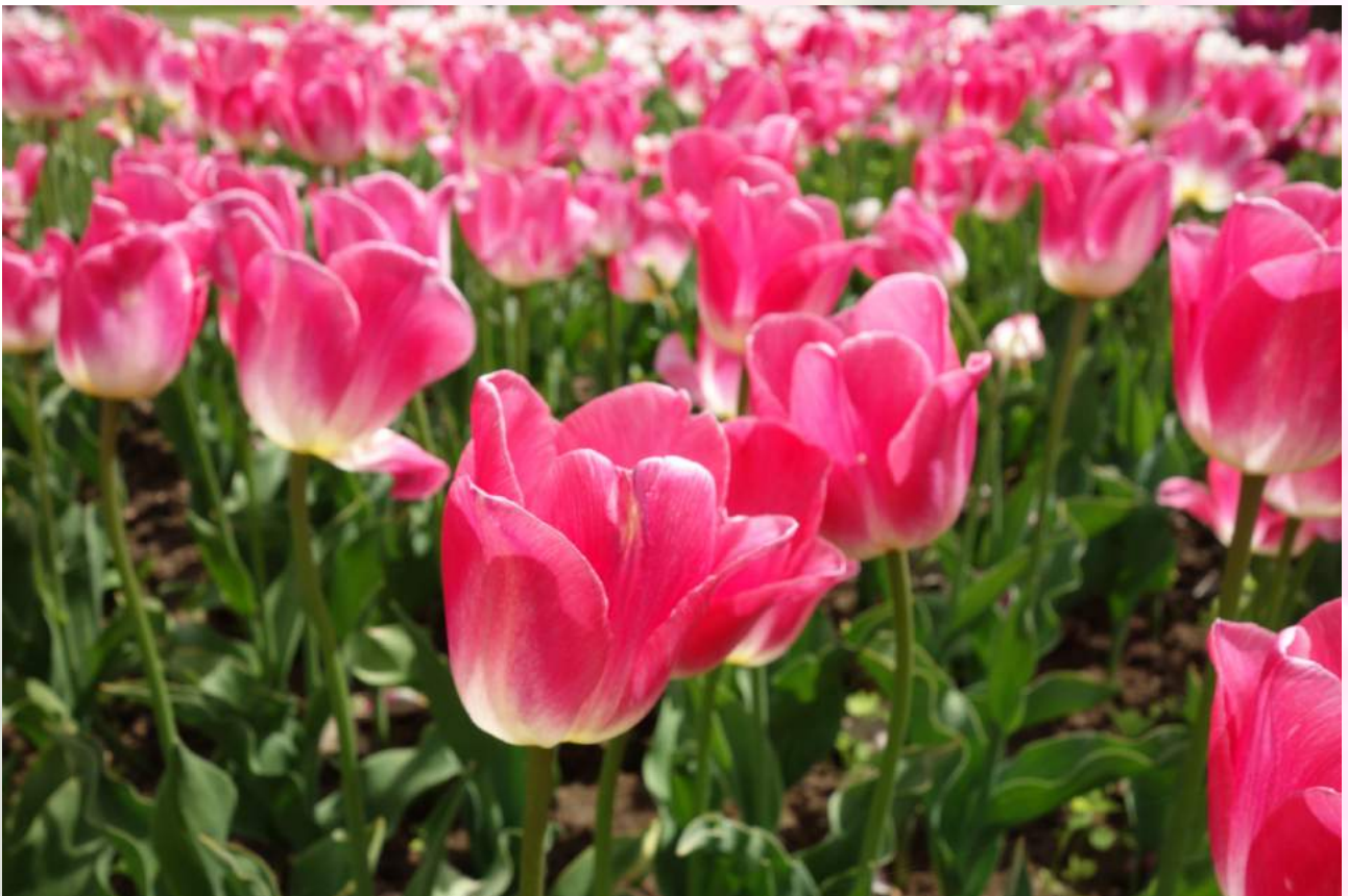
Kasvitieteellinen puutarha, Tallinna.